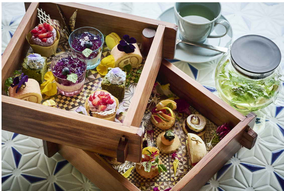
あじさいアフタヌーンティー

URL: https://hakonegora.hotelindigo.com/offers/rooms/39ajisairetreat/