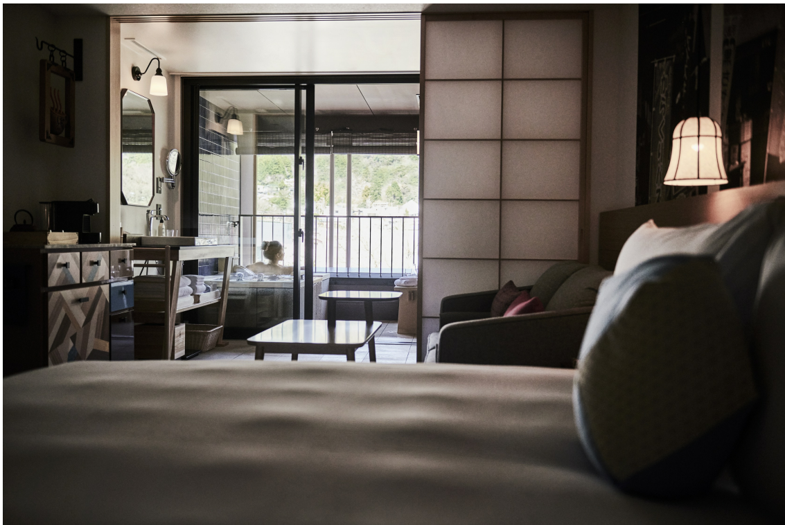
温泉風呂付き客室

箱根の初夏の風物詩といえばあじさい。間近であじさいが楽しめる「あじさい電車」の他、箱根にはあじさいの名所が盛りだくさんです。ホテルインディゴ箱根強羅では、初夏の光が差し込む広々とした空間で、あじさいをイメージしたアフタヌーンティーを、「サンキュー」の気持ちを込めた39時間ゆったりステイプランで提供します。